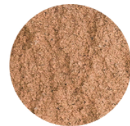
CAFÉ PIXES (TF 809)