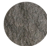
NEGRO HUMO NPA (121)