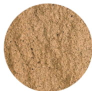
CAFÉ PIGMA (C800)