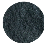
NEGRO INTENSO (NPA 140)