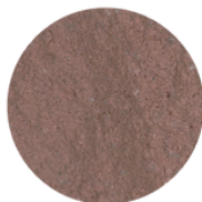
CAFÉ CHOCOLATE (C879)