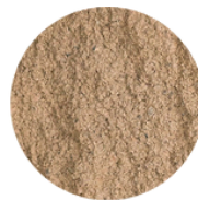
CAFÉ BETA (C860)